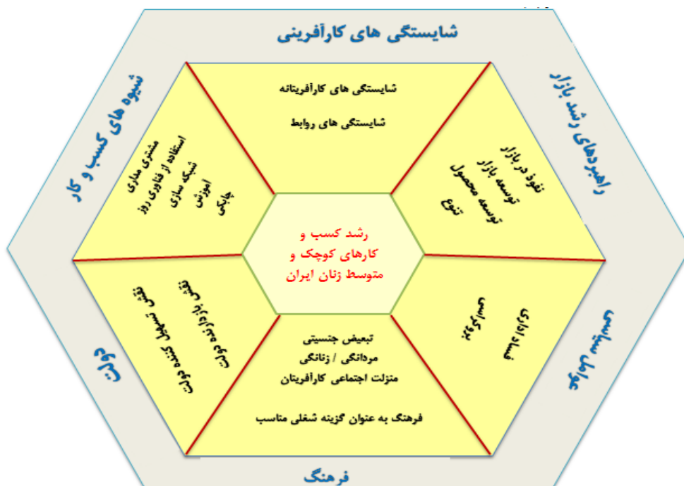
شکل (۲). مدل نهایی پژوهش